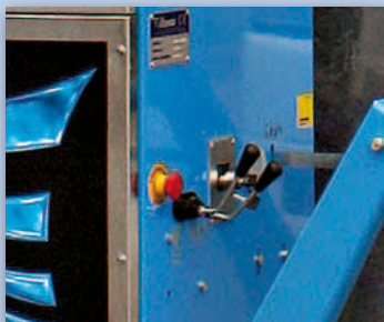
Comandi per azionamento e inclinazione spazzola Controls for drive and tilting brush systems.