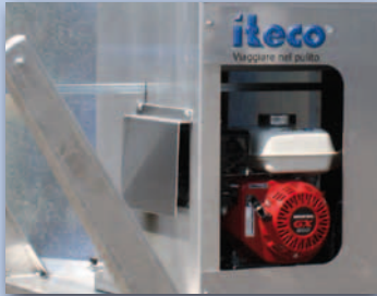
Gruppo motore Benzina. Motor Unit Petrol.

Light alloy frame. Available in various motorizations: Honda petrol engine 6,5 hp, Diesel engine 7,5 HP and electric motor, powered by batteries. Water tank 200 Litres. Tilting brush. Hydraulic Traction. Double Controls. Special trolley with 6 wheels. Brush Diameter 1000 mm. Bronze water pump.