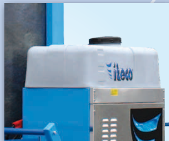
Serbatoio acqua. Water tank.