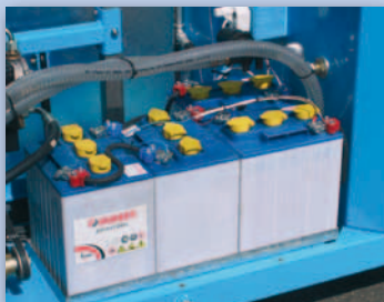
Gruppo batterie 24V. Unit batteries 24V.