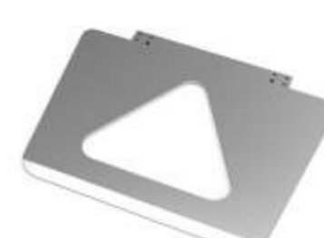
Pedane caricamento In due diverse misure per affrontare ogni spostamento