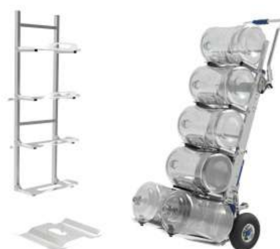
Supporto taniche acqua Fino a 6 ricariche dispenser acqua