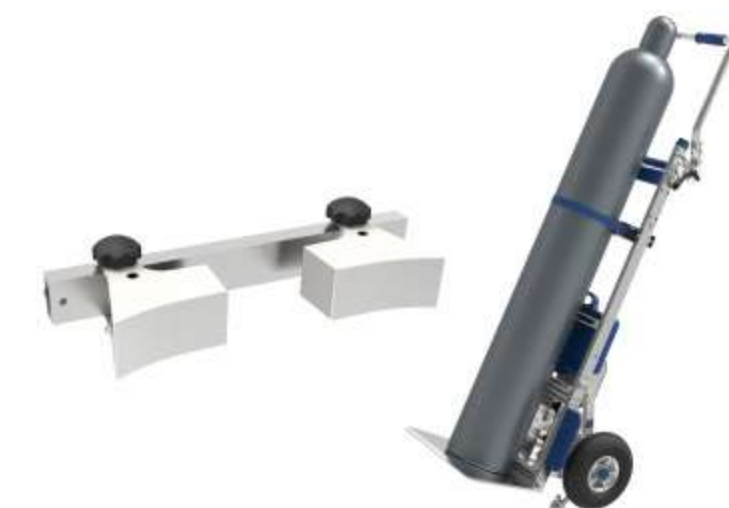
Supporto per forme cilindriche Per fissare in modo saldo oggetti di forma cilindrica