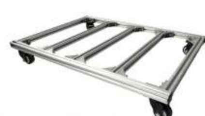
Dispositivo scivolamento Perfetto per angoli e spazi stretti