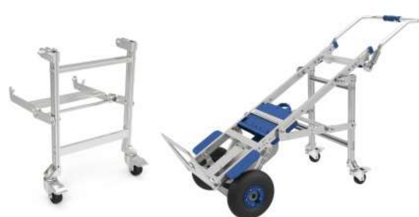
Supporto carichi pesanti Ideale per scaricare a terra i carichi più pesanti