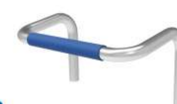
Maniglia Pratica e comoda per spostare agevolmente il carrello