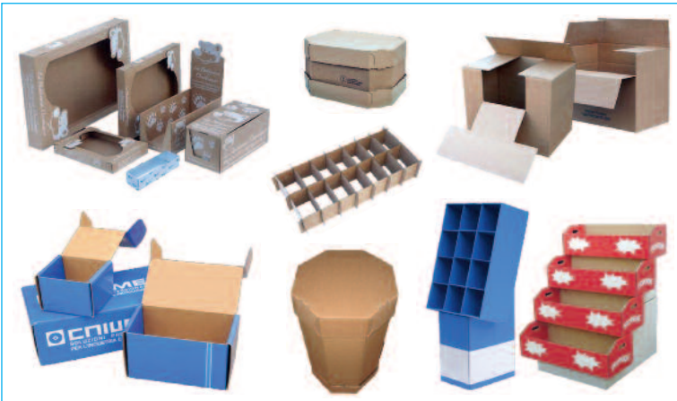
Scatole ed espositori in cartone di vari formati, con personalizzazione - Divisori in cartone - Octabin