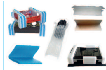
Angolari, protezioni e gonfiabili in plastica