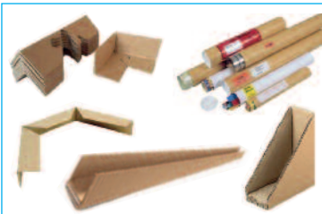
Angolari, protezioni e imballi a tubo in cartone