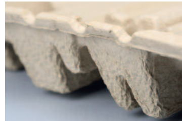
Imballo in polpa - particolare