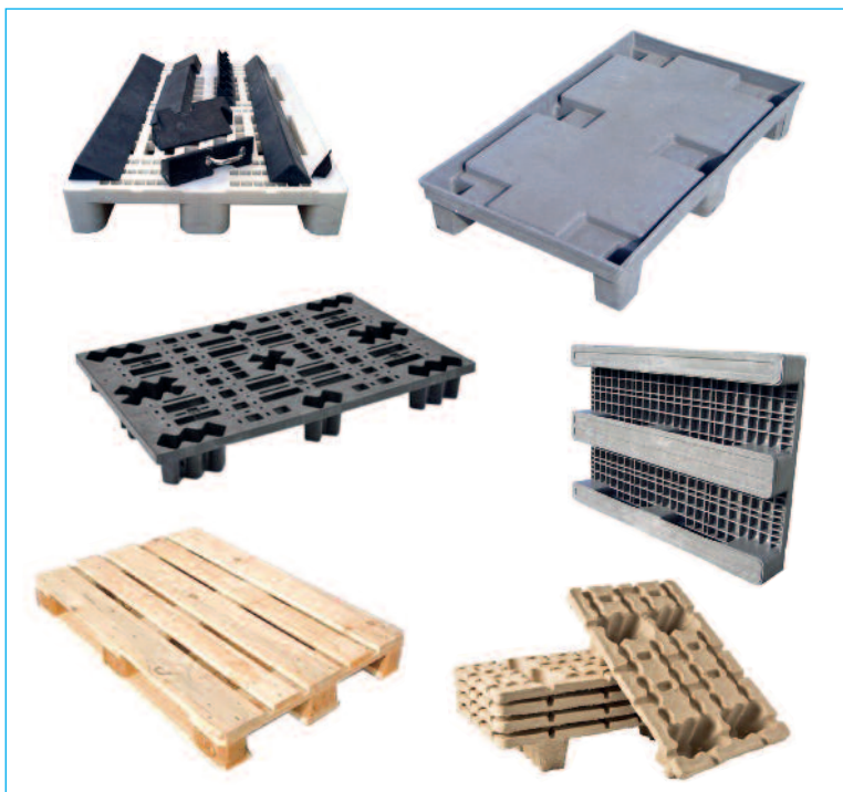
Pallet in plastica, legno, cartone pressato