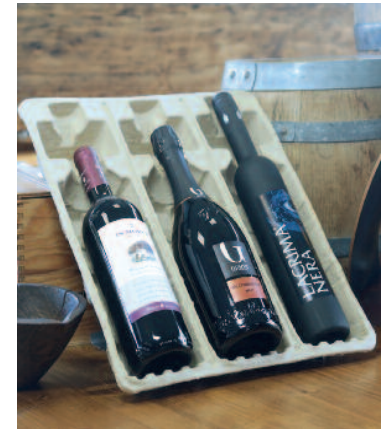
Imballi antiurto in polpa per bottiglie