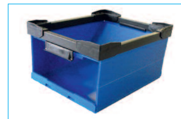
Cassa pallet pieghevole