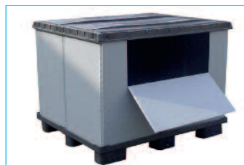
Cassa pallet integrata