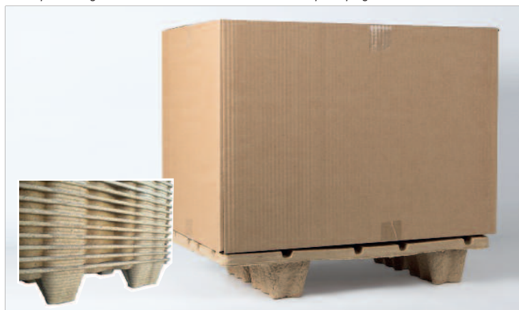
Pedana in polpa e cassa in cartone