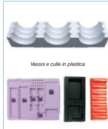
Vassoi e culle in plastica

EREDI CAIMI fornisce qualsiasi tipo di materiale di riempimento per la protezione interna: spagnolette, patatine anche ecologiche, paglietta, trucioli di cellophane, sistemi di riempimento, sacchetti ad aria, lastre in gommapiuma ed agglomerato, polistirolo a lastre e sagomato, angolari in cartone, espanso e stratocel, buste bolle aria, poltine, foam, contenitori isotermitici, per bottiglie e per settori specifici.