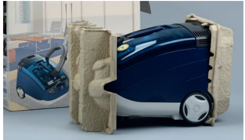
Imballo in polpa a misura di prodotto per aspirapolvere